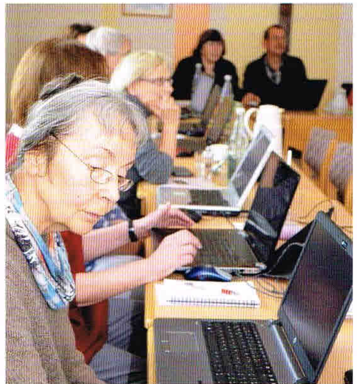
Da muss man sich schon konzentrieren.

nioren wollen und sollen auf der Höhe der Zeit sein. Gerade die Welt des Internets und andere Annehmlichkeiten erschließen sich durch die Nutzung eines Tischcomputers, Laptops oder Tablet-PCs.